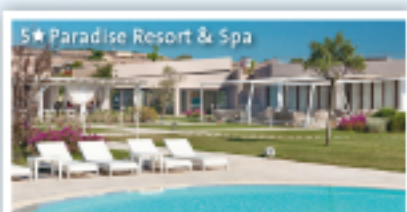
5★ Paradise Resort & Spa

Im 5★ Paradise Resort & Spa (Landeskategorie) in San Teodoro wohnen Sie in modernen Zimmern mit Bad oder Dusche/WC, Fön, Klimaanlage, Telefon, Flachbildschirm-TV sowie Balkon oder Terrasse. Zur weiteren Resort-Ausstattung gehören Außenpool, Sonnenterrasse, Fitnessstudio, Sauna, Dampfbad, Beauty- und Wellnessbereich (gg. Gebühr) sowie ein Privatstrand.