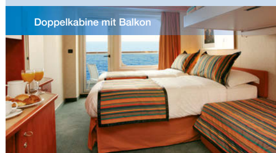
Doppelkabine mit Balkon