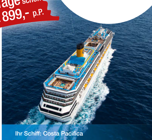
Ihr Schiff: Costa Pacifica