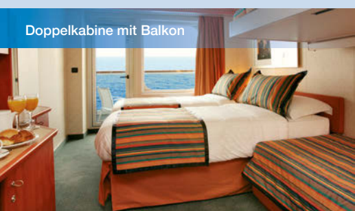
Doppelkabine mit Balkon