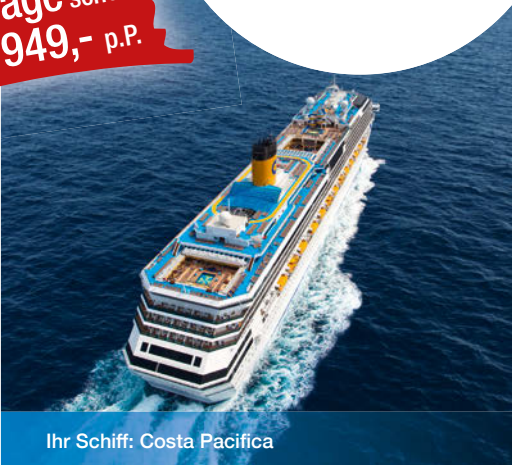
Ihr Schiff: Costa Pacifica