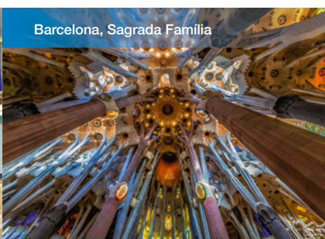
Barcelona, Sagrada Família