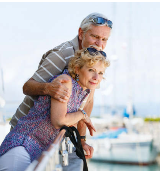
Málaga, Caminito del Rey